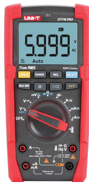
● UT17B PRO