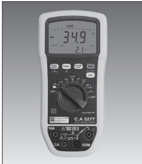
Chauvin Arnoux C.A 5277